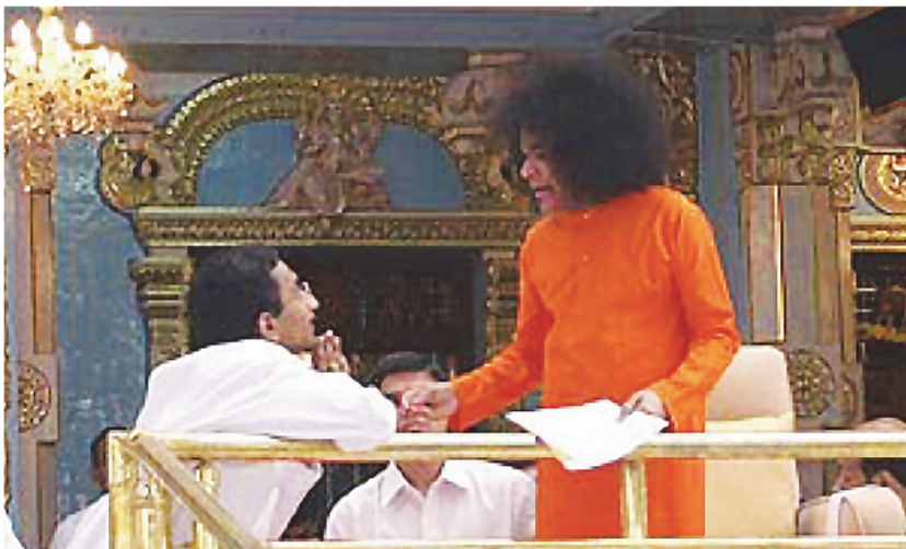
Ο συγγραφέας συνομιλεί με τον Διευθύνοντα της καρδιάς του

Τον Ιανουάριο του 2007 ένας από του συνεργάτες μας τραυματίστηκε σοβαρά στο δρόμο για το σπίτι του επιστρέφοντας από την δουλειά αργά το βράδυ. Οι γιατροί τα είχαν παρατήσει, καθώς είχε μείνει